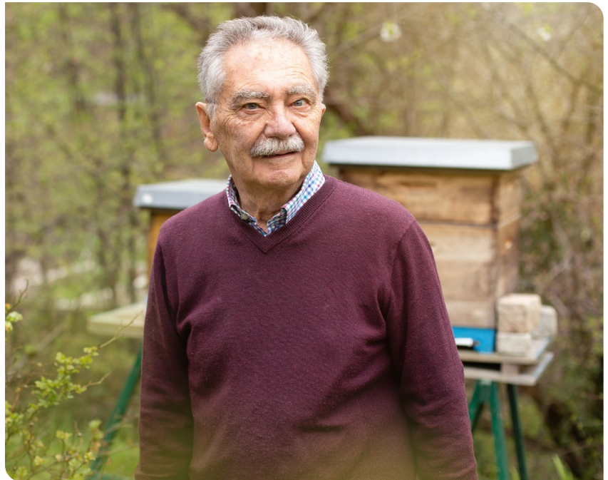
Trotz anfänglicher Probleme ist Herr Hannus mittlerweile überzeugter TEO Nutzer

Ja, ich bin schließlich seit Jahrzehnten Kunde der Sparda-Bank München. Seit es möglich war, habe ich das Online-Banking genutzt. Das alte hat ja auch schon gut funktioniert.