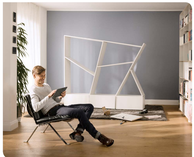
Eine entspannte Geldanlage kann einfacher sein als ein Regal zusammenzubauen

MeinInvest ermittelt ganz einfach auf Basis Ihrer Angaben, zum Beispiel zu Ihrer Risikoneigung oder Ihren Zielen, eine für Sie passende Geldanlage. Sie selbst genießen große Flexibilität: So können Sie beispielsweise jederzeit Ihre Sparrate verändern oder aussetzen. Auch Einmaleinzahlungen oder Aus- und Zuzahlungen sind jederzeit möglich. Entscheiden Sie sich für eine MeinInvest-Geldanlage, können Sie alles direkt über Ihren Computer abwickeln und zukünftig über Ihr MeinInvest-Benutzerkonto Ihre Anlage jederzeit und von überall online verwalten.